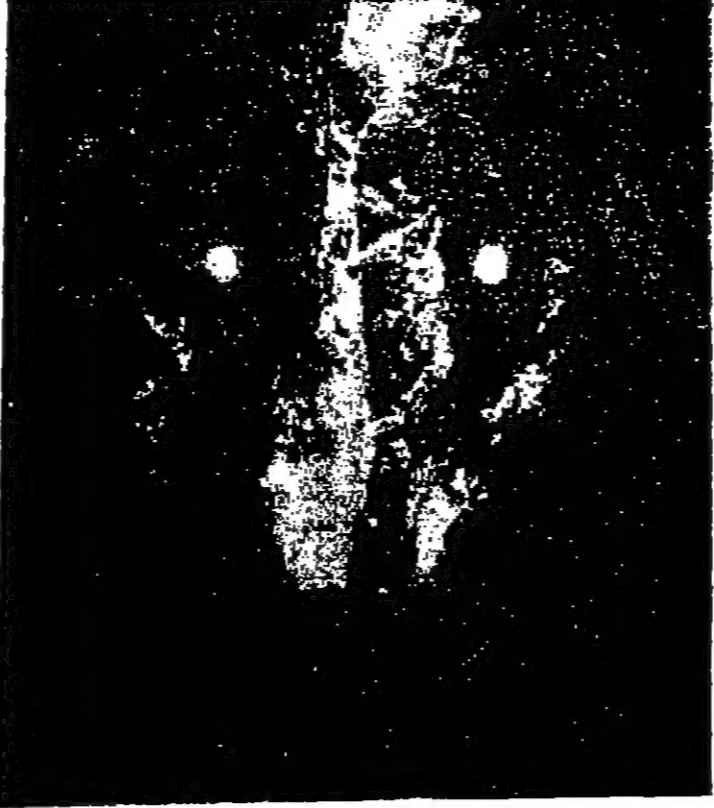
أته قتل أما «سوزان بيرك» قتل اجابت دورها تماماً.

تيلوت المركب الوحيد في العالم لا ذلة الشيب من السيدات والرجال ولعوده شريك إلى لون الطبيب بطريقة طبيعية في أيام قليلة. انه لا يحتوي على مواد صباغية بشاتاً. يباع في جميع الصيدليات ومحلات التجميل